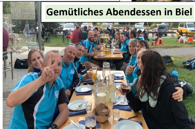
Gemütliches Abendessen in Biel