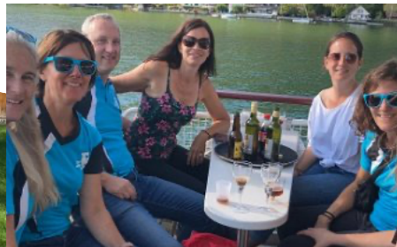
Schiffahrt Richtung Biel