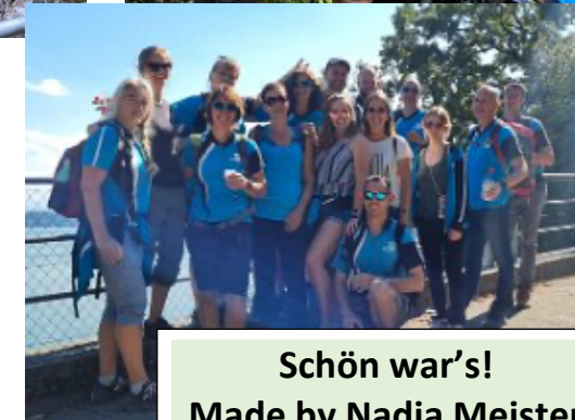
Schön war's! Made by Nadia Meister