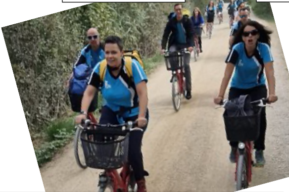
Mit hochmodernen Velos fuhren wir auf die St. Petersinsel