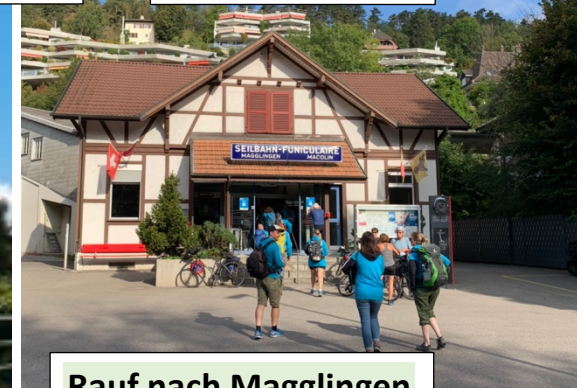
Rauf nach Magglingen