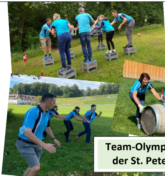
Team-Olympiade auf der St. Petersinsel