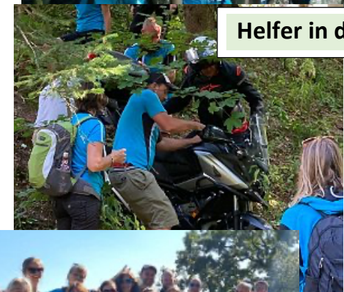
Helfer in der Not